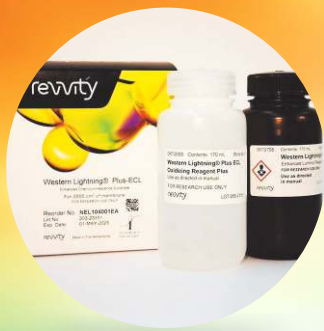
Western Blot ECL 冷光試劑